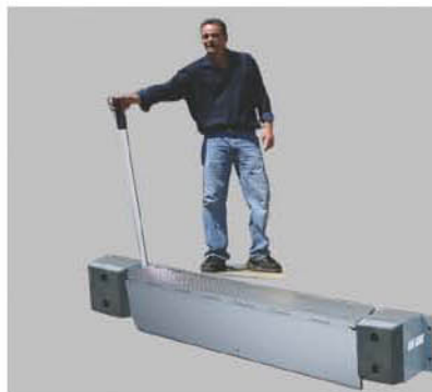
Insérez la poignée de commande confortable