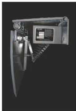
Position rangée de repos

Le niveleur monté-sur-rive mécanique Série MD-CM de Blue Giant est idéal quand une installation en fosse n'est pas réalisable, ou quand des camions avec hauteur de plateau standard sont desservis au quai de chargement. La Série MD-CM est facilement installée sur le front du quai, fournissant une unité efficace avec rangement automatique, remplaçant une plaque de chargement encombrante.