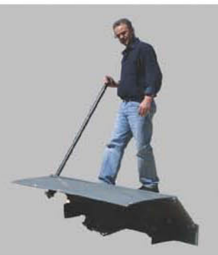
Poussez vers l'avant