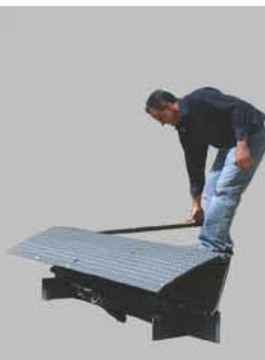
Tirez la poignée